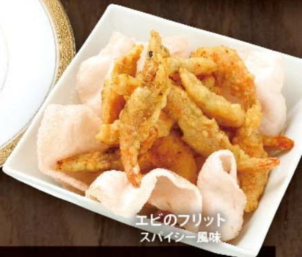
エビのフリット スパイシー風味

コールドビーフ 1,100円 (税込) 柔らかく調理した牛肉の美味しさに、 ガーリック風味のソースが良く合います。 エビのフリット スパイシー風味 800円 (税込) スパイシーな風味! えびせんべい添え。 牛ハラミの炙り焼き 1,500円 (税込) 香ばしく焼き上げ、熱々の鉄板で提供いたします。