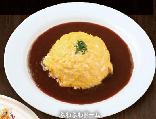
ふわふわドーム オムライス