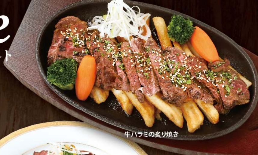
牛ハラミの炙り焼き