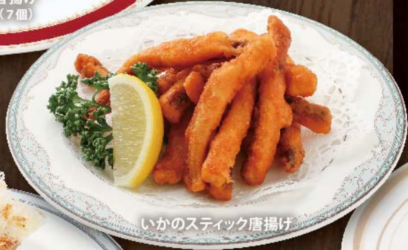
いかのスティック唐揚げ

鶏の唐揚げ 自慢のタレで漬け込みました。 レギュラーサイズ 7個 780円 (税込) スモールサイズ 4個 480円 (税込) いかのスティック唐揚げ 780円 (税込) やみつきになる一品です。 ドームトンテキ 980円 (税込) にんにくを効かせたソースで仕上げます。 レモンで味の変化をお楽しみください。