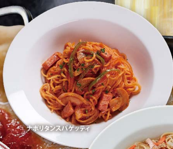
ナポリタンスパゲッティ