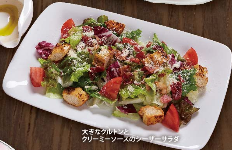
大きなクルトンと クリーミーソースのシーザーサラダ