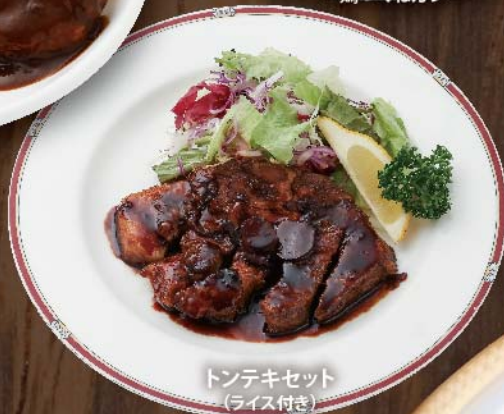
トンテキセット (ライス付き)