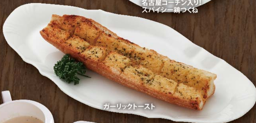
ガーリックトースト