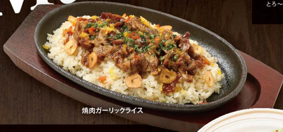
焼肉ガーリックライス