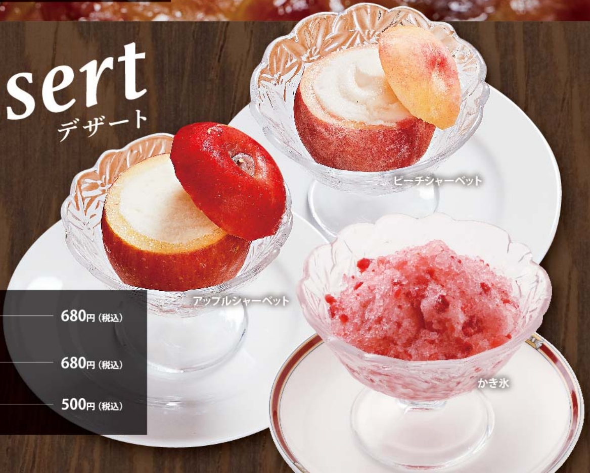
ピーチシャーベット