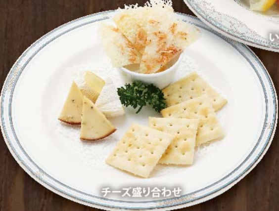
チーズ盛り合わせ

お手軽セット 1,880円 (税込) 枝豆、鶏の唐揚げ、豚串カツ、ソーセージ、ポテトフライ、 スライスソーセージ、ポテトサラダ、アサヒ生ビール (通称マルエフ) 1杯 チーズ盛り合わせ 950円 (税込) シュリンプチーズ・カマンベール・スモークの3種です。