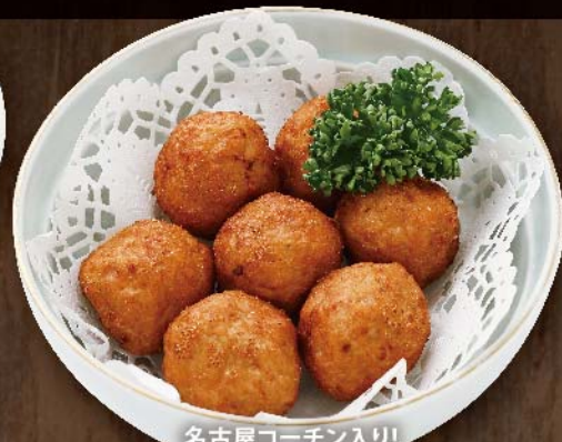
名古屋コーチン入り! スパイシー鶏つくね