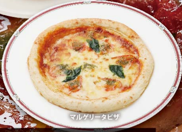
マルゲリータピザ