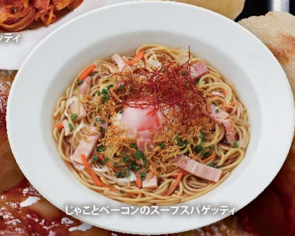
じゃことベーコンのスープスパゲッティ

ミックスピザ 1,000円 (税込) ソーセージ・ベーコン・ピーマンをトッピング。