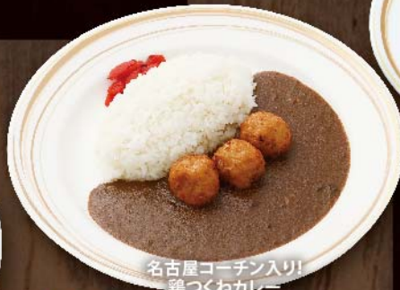
名古屋コーチン入り! 鶏つくねカレー

ハンバーグ&海老フライ (ライス付) 1,430円(税込) 欲張りなセットメニューです。