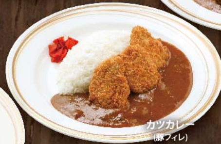
カツカレー (豚フィレ)

名古屋コーチン入り! 鶏つくねカレー 900円(税込) 名古屋コーチン入り! 鶏つくねカレー。