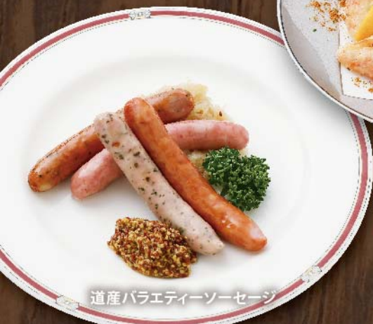
道産バラエティーソーセージ