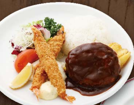
ハンバーグ&海老フライ (ライス付き)

トンテキセット (ライス付) 1,280円(税込) にんにくを効かせたソースで仕上げます。レモンで味の変化をお楽しみください。