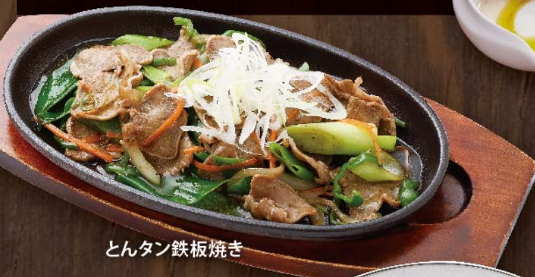
とんたん鉄板焼き