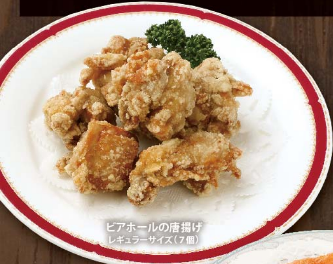
ピアホールの唐揚げ レギュラーサイズ(7個)

コールドビーフ 1,100円 (税込) 柔らかく調理した牛肉の美味しさに、 ガーリック風味のソースが良く合います。 エビのフリット スパイシー風味 800円 (税込) スパイシーな風味! えびせんべい添え。 牛ハラミの炙り焼き 1,500円 (税込) 香ばしく焼き上げ、熱々の鉄板で提供いたします。