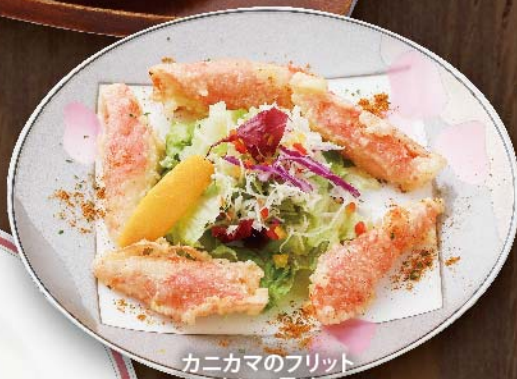
カニカマのフリット カレー風味