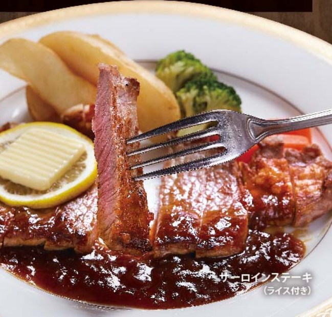
サーロインステーキ (ライス付き)